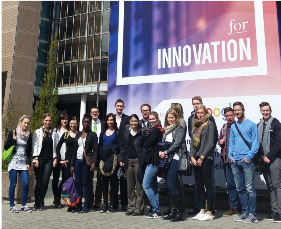
Studenten der Fachrichtung Wirtschaftsingenieurwesen auf Exkursion auf der Hannover Messe