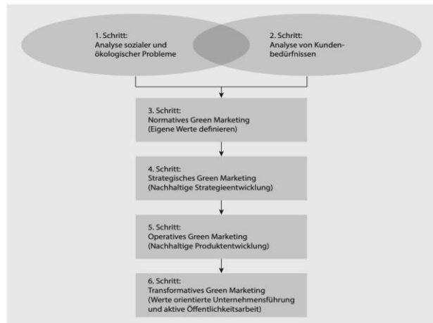
Abbildung 5 - Die sechs Schritte des Green Marketing (Scholz, Ulrich (2018), S. 45.)

Die Grenzen des Greenwashing sind fließend. So könnte die Conscious Collection des Modehauses H&M als „Schritt in die Richtige Richtung“ betrachtet werden – „besser als gar nichts“. Um tatsächlich beurteilen zu können, ob es ein Unternehmen ernst mit seiner grünen Kampagne meint, muss ein Blick auf die langfristigen Strategien geworfen werden. Bewirbt der Fast Fashion Konzern aktiv die nachhaltigeren Kollektionen und hat sich zum Ziel gesetzt, bis 2050 nur noch Bio-Baumwolle für die Herstellung seiner Kleidung zu benutzen, an seinen Standorten Klimaneutralität zu erreichen oder nur noch Kleidung mit anerkannten Zertifizierungen herzustellen, kann angenommen werden, dass hier langfristige Besserung angestrebt und eine Strategie verfolgt wird. Zu einem bestimmten Zeitpunkt kann sicherlich festgestellt werden, ob ein Unternehmen Greenwashing betreibt, indem Lieferketten und Geschäftsberichte untersucht und mit kommunikativen Aspekten verglichen werden. Sinnvoll ist jedoch auch, einen Zeitraum zu betrachten und auf Entwicklungen und Fortschritte zu analysieren. Sind geplante Ziele erreicht worden oder werden neue höhere Ziele gesetzt, ist die grüne Kommunikation evtl. Teil der langfristigen nachhaltigen Entwicklung.