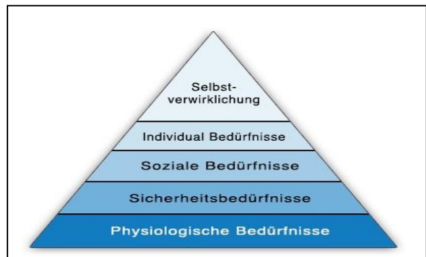
Abbildung 2 - Abbildung 2: Bedürfnispyramide nach Maslow (BWL-Wissen.net (o.A.))

z.B. das Streben nach Anerkennung und Sicherheit. Die Bedürfnispyramide nach Maslow kann mit der sozialen Nachhaltigkeit in Verbindung gebracht werden, da sie eben jene grundlegenden Bedürfnisse des Menschen beschreibt.